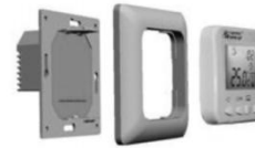
Схема сборки терморегулятора для установки в монтажную коробку.